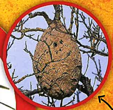
Nid de frelon asiatique